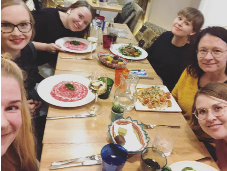
Vuoden 2020 hallituslaisia kokoustamassa ravintola Nomadissa.

Vuosikokouksen lisäksi kukin hallitus on kokoustanut virallisesti keskimäärin 6 kertaa vuodessa. Tämän lisäksi esimerkiksi koulutusten suunnittelua varten on pidetty epävirallisia lisäkokouksia.