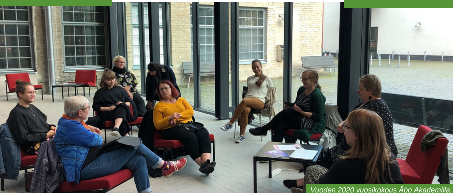
Vuoden 2020 vuosikokous Åbo Akademilla.